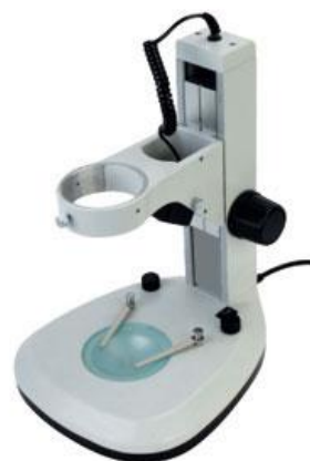
J3 LED 方柱機座