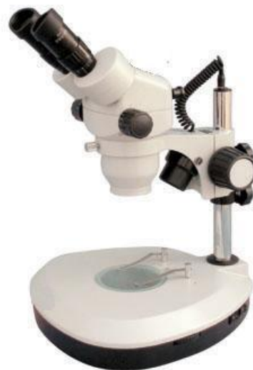
MD0745TL DZ06 上下鹵素