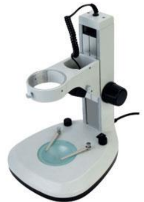
J3 LED 方柱機座